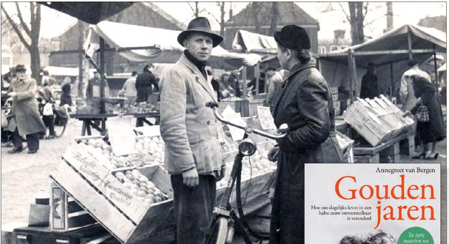
▲ De markt was belangrijk in de jaren 50.