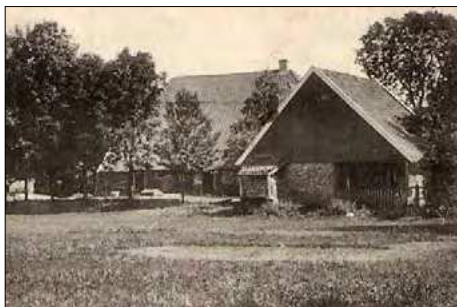
▲ Boerderij "Het Hof" in Boekelo, plaats van het vroegere kasteel.

Als iemand in staat en bereid is om mee te werken aan de uitgave van "Boekelo", graag contact opnemen met de voorzitter of secretaris van de Boerderijcommissie.