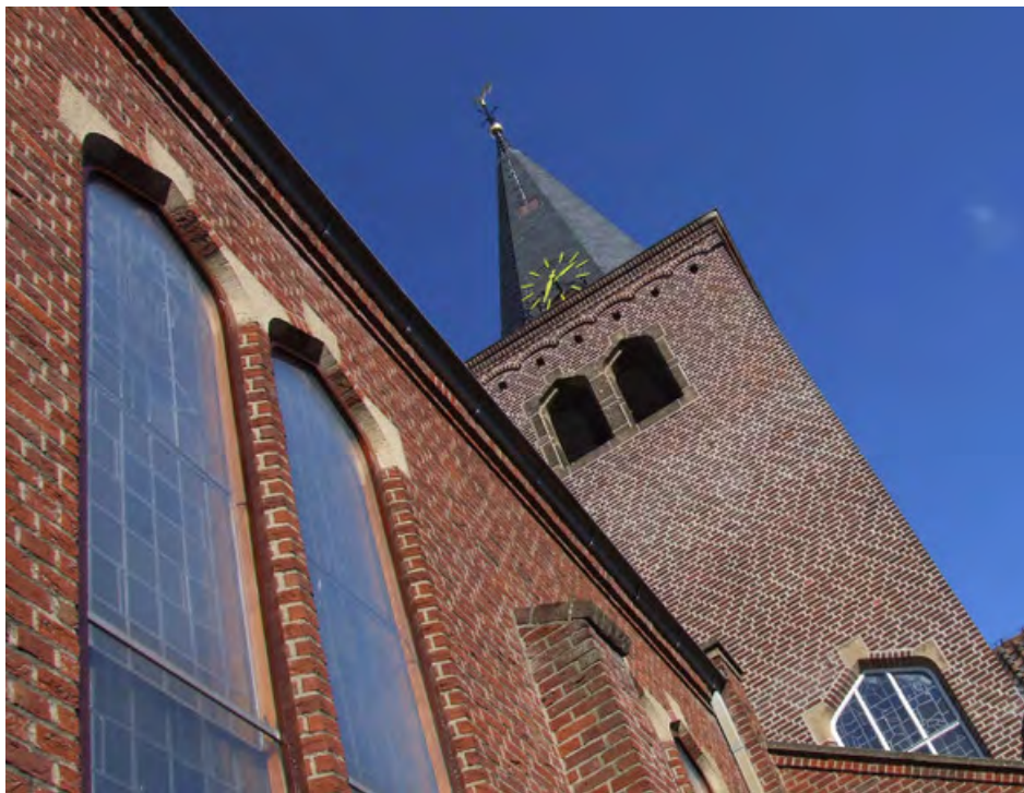
▲ Ontmoetingskerk aan de Varviksingel.