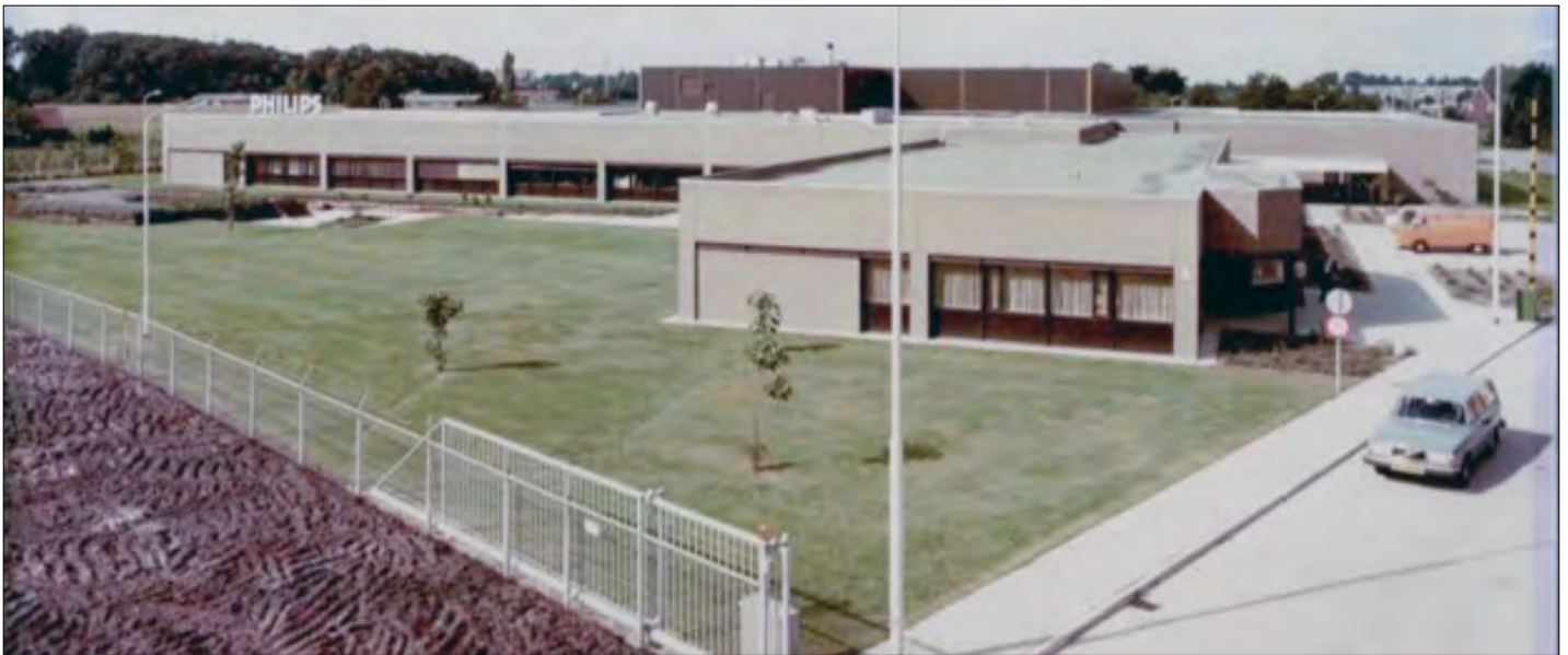
▲ Oscilloscoopfabriek Philips aan de Kuiperdijk omstreeks 1979.