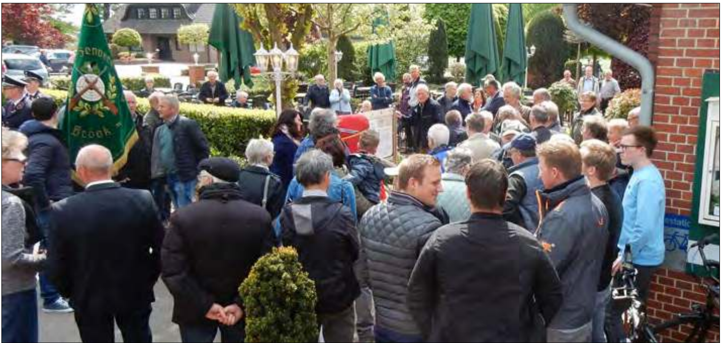
▲ De onthulling in de tuin van café-restaurant Sandersküper, vlak bij de voormalige grensovergang aan de Knalhutteweg.

UITGAVE VAN STICHTING HISTORISCHE SOCIËTEIT ENSCHEDE-LONNEKER