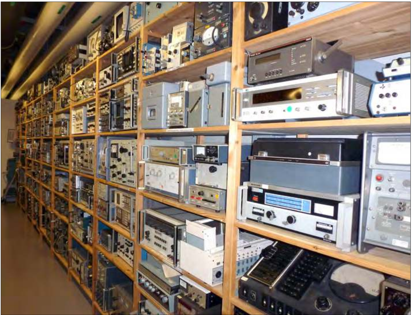
▲ Een deel van de bonte collectie elektronische, elektrische en mechanische apparaten.