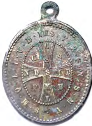
▲ "Crux Sancti Patri Benedicti" (Het Kruis van de heilige vader Benedictus).