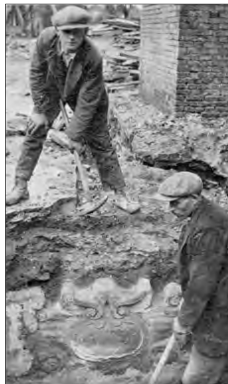
▲ Graafwerkzaamheden 1930.

De werken worden uitgevoerd naar de plannen en onder leiding van den heer G. Friedhoff, Architect B.N.A. te Haarlem. De opdracht aan den Architect heeft plaats gehad bij keuze uit ingezonden plannen van vijf daartoe uitgenoodigde Architecten. De eerste steenlegging is geschied in tegenwoordigheid van het Gemeentebestuur en genodigden. Bij deze Oorkonde is gevoegd: een stel teekeningen van den bouw en een verzameling van de geldende munten. Het bevolkingscijfer van Enschede bedroeg op 1 September 1920: 52.374. inwoners".