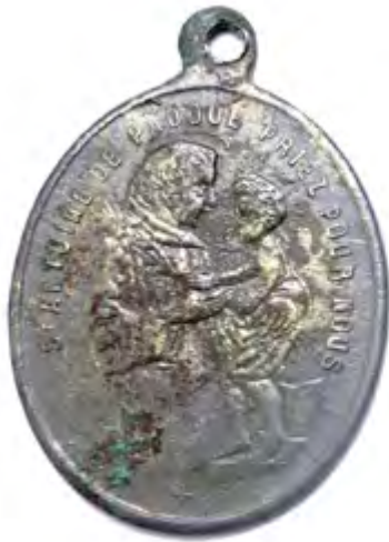
▲ "St. Antoine de Padue priez pour nous" (Heilige Antonius van Padua bidt voor ons).

UITGAVE VAN STICHTING HISTORISCHE SOCIËTEIT ENSCHEDE-LONNEKER