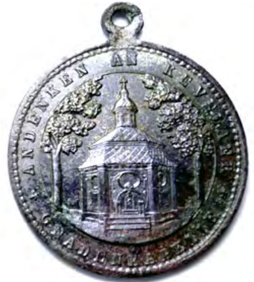
▲ "Andenken an Kevelaer Gnaden Kapelle". Op de achterzijde staat geschreven: "Maria Consolatrix Afflictorum" (Maria troosteres der bedroefden).