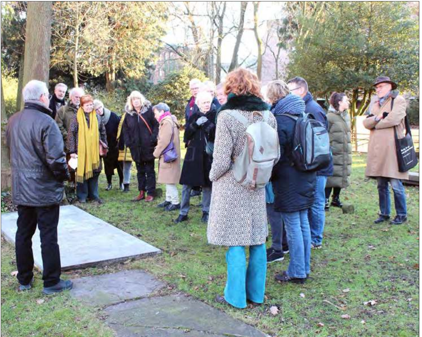
▲ Belangstellenden op het Boerenkerkhof.

UITGAVE VAN STICHTING HISTORISCHE SOCIËTEIT ENSCHEDE-LONNEKER