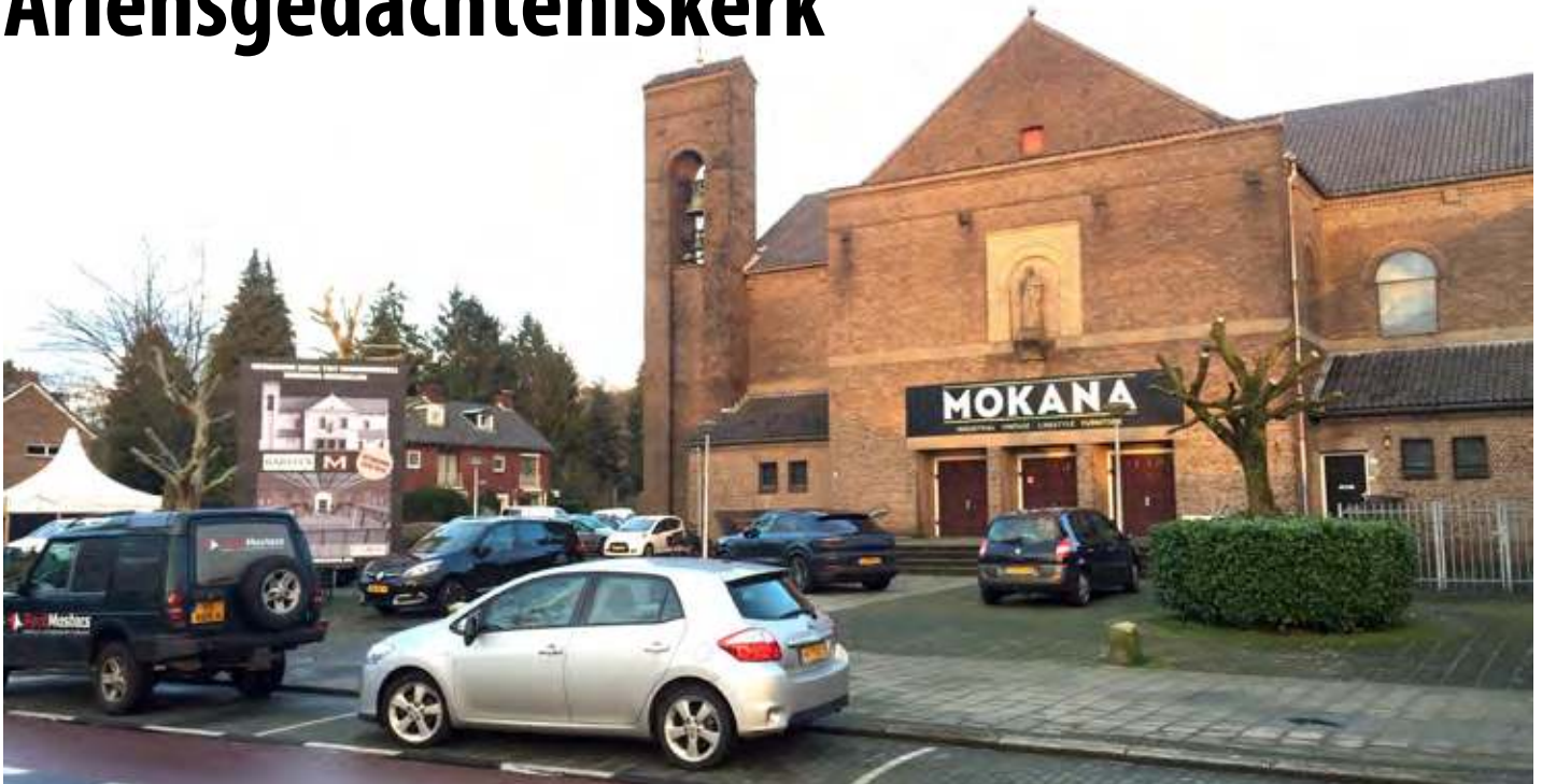
▲ De voormalige Ariënsgedachteniskerk aan de Hogelandsingel 39.