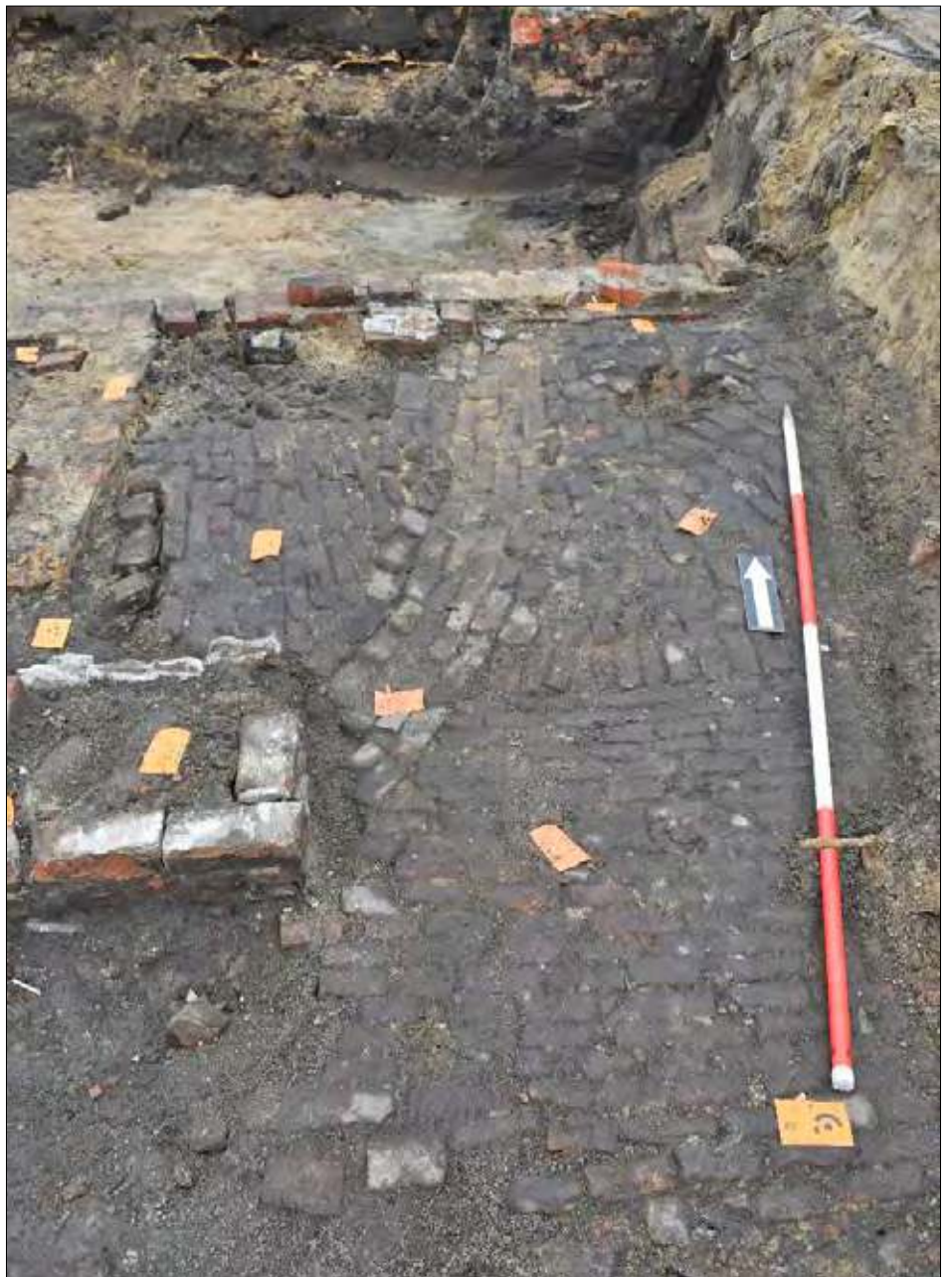
▲ Een negentiende-eeuws bestraat weggetje met een watergootje, fundamenteën van een arbeiderswoninkje en op de achtergrond verschillende lagen in de bodem met nog een muurdeel. Gele kaartjes als markering van vondsten (lees scherven, botjes) en meetpunten.

Dit onderzoek biedt meer informatie over hoe mensen in deze tijd leefden en over hoe Enschede eruitzag in deze periode. Het kan nieuwe invalshoeken bieden en mooie verrassingen opleveren, want archeologisch gezien is er nog niet zo veel bekend over Enschede.