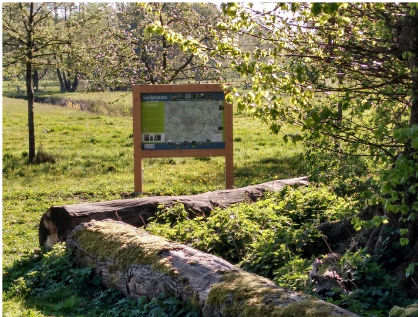
Het informatiepaneel bij de Viermarkenlinde.

Filmpje van de plaatsing van het informatiepaneel: https://www.youtube.com/watch?v=AkzjCQMvphA&feature=youtu.be