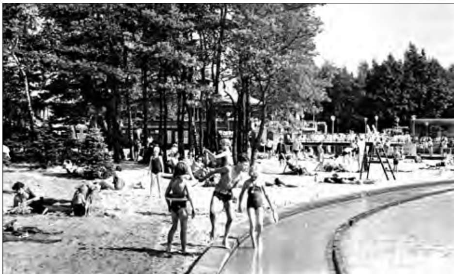
▲ Bad Boekelo op een ansichtkaart uit 1960.