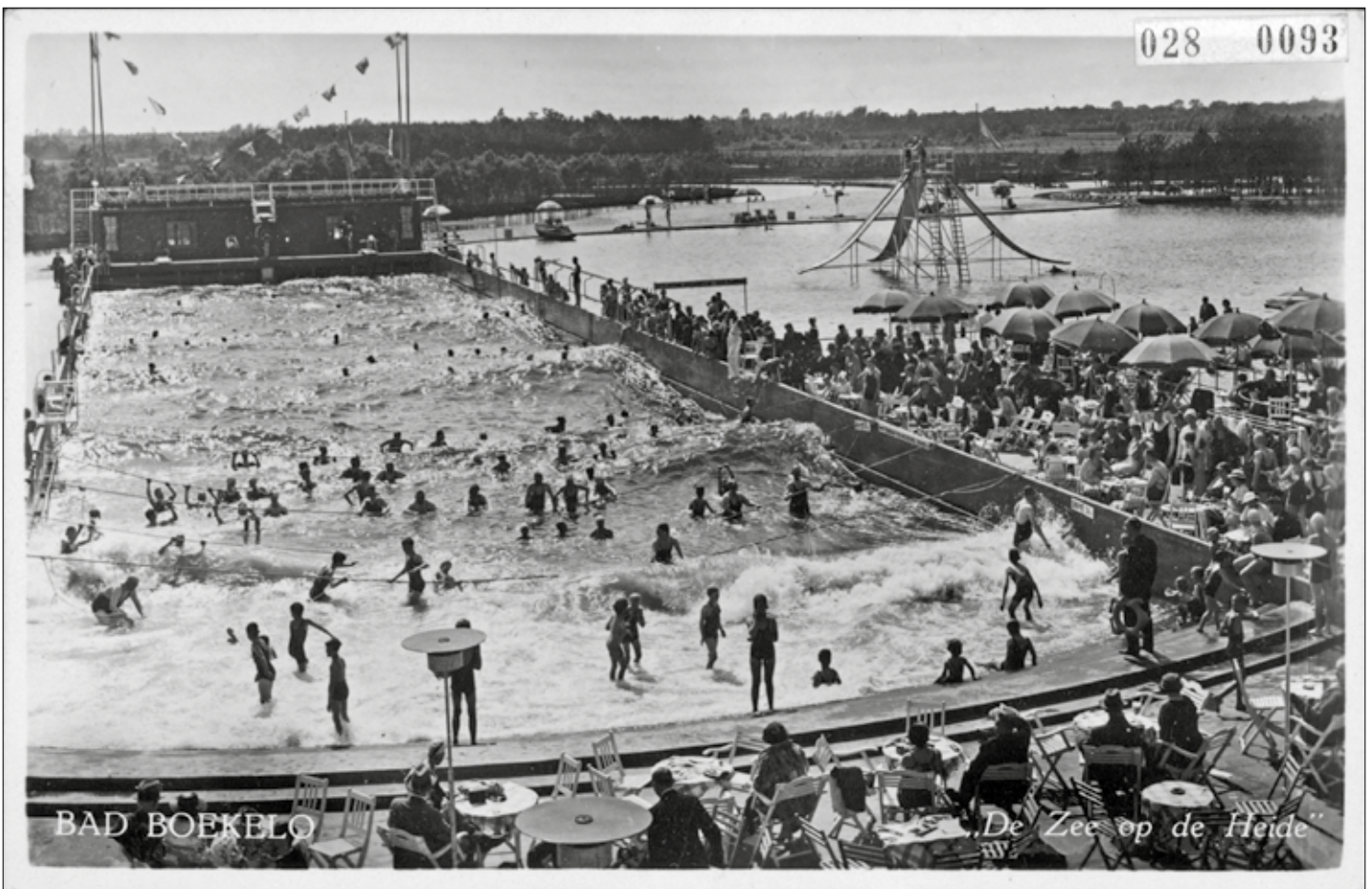
▲ Bad Boekelo: "De zee op de heide" op een Ansichtkaart uit 1940.

UITGAVE VAN STICHTING HISTORISCHE SOCIËTEIT ENSCHEDE-LONNEKER