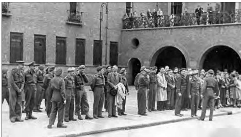
▲ Vertrek vanaf het stadhuis in Enschede.

► Het derde boek van de Historische Kring Glanerbrug: "Stil... zwijgend" over de uitzending van Glanerbrugse jongens en mannen tussen 1945 en 1962 naar Nederlands-Indië en Nieuw-Guinea is zo goed als klaar. De drukker zal de oplage van 750 exemplaren naar verwachting op 6 november afleveren. We hebben er ruim twee jaar aan gewerkt, tientallen families van oud-militairen zijn benaderd, materialen verzameld