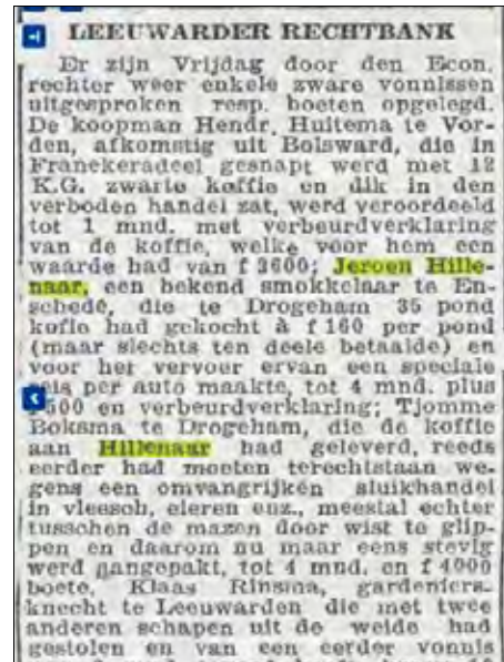
▲ Knipsel van het Nieuwsblad van Friesland uit 28 augustus 1944.