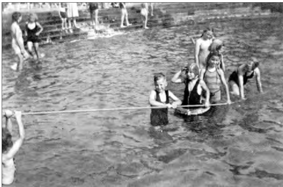
▲ Bad Boekelo: een warme zomervrijdag in 1947.

De golven kwamen snel en met geweld op ons af. Het water bolde onze badpakjes op en bij vader zijn broek. Dan trok het water terug en.... o, help... vader had beide handen nodig om, én het touw én zijn broek vast te houden en daar stond hij hulpeloos, piemelnaakt aan het touw. Mijn moeder snelde naar hem toe, haar watervrees negerend, en sjoerde snel zijn broek omhoog. Van de kant klonk luid applaus!