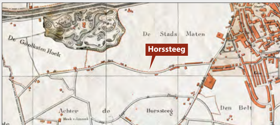
▲ Uitsnede kaart 1884

haar dochter Wilhelmina. In 1903 kreeg het gedeelte van de Zwedeweg tot de grens bij de Dennenweg de naam 'Tweede Emmastraat'.