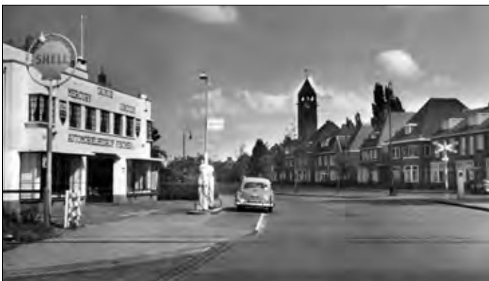
▲ Lasondersingel is aangelegd tussen 1920 en 1921, de foto is omstreeks 1955 genomen.