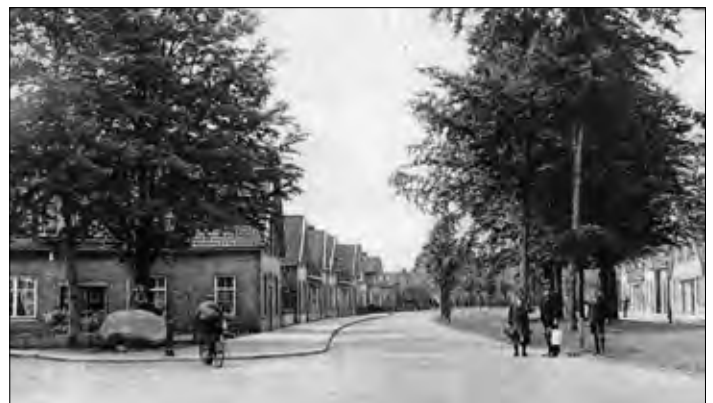
▲ Pathmossingel is aangelegd tussen 1919 en 1921, de foto is omstreeks 1925 genomen.