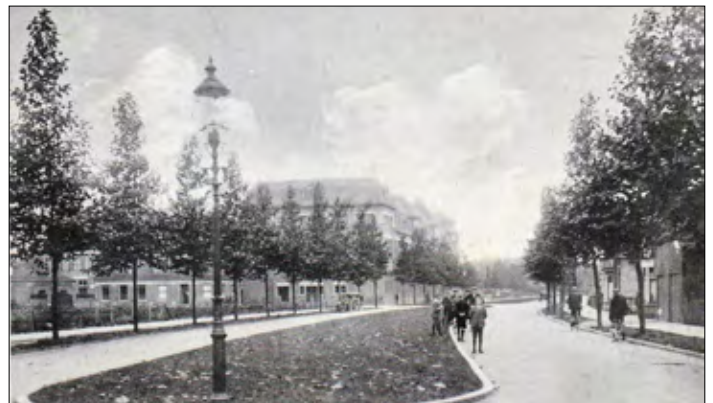
▲ Boddekampsingel is aangelegd tussen 1916 en 1917, de foto is omstreeks 1930 genomen.