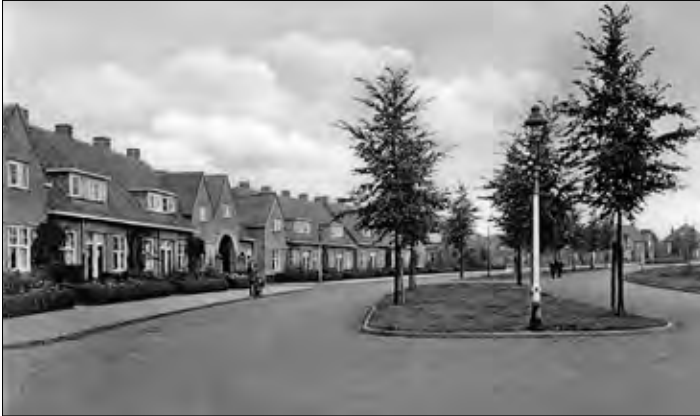
▲ Varviksingel is aangelegd in 1929, de foto is omstreeks 1935 genomen.