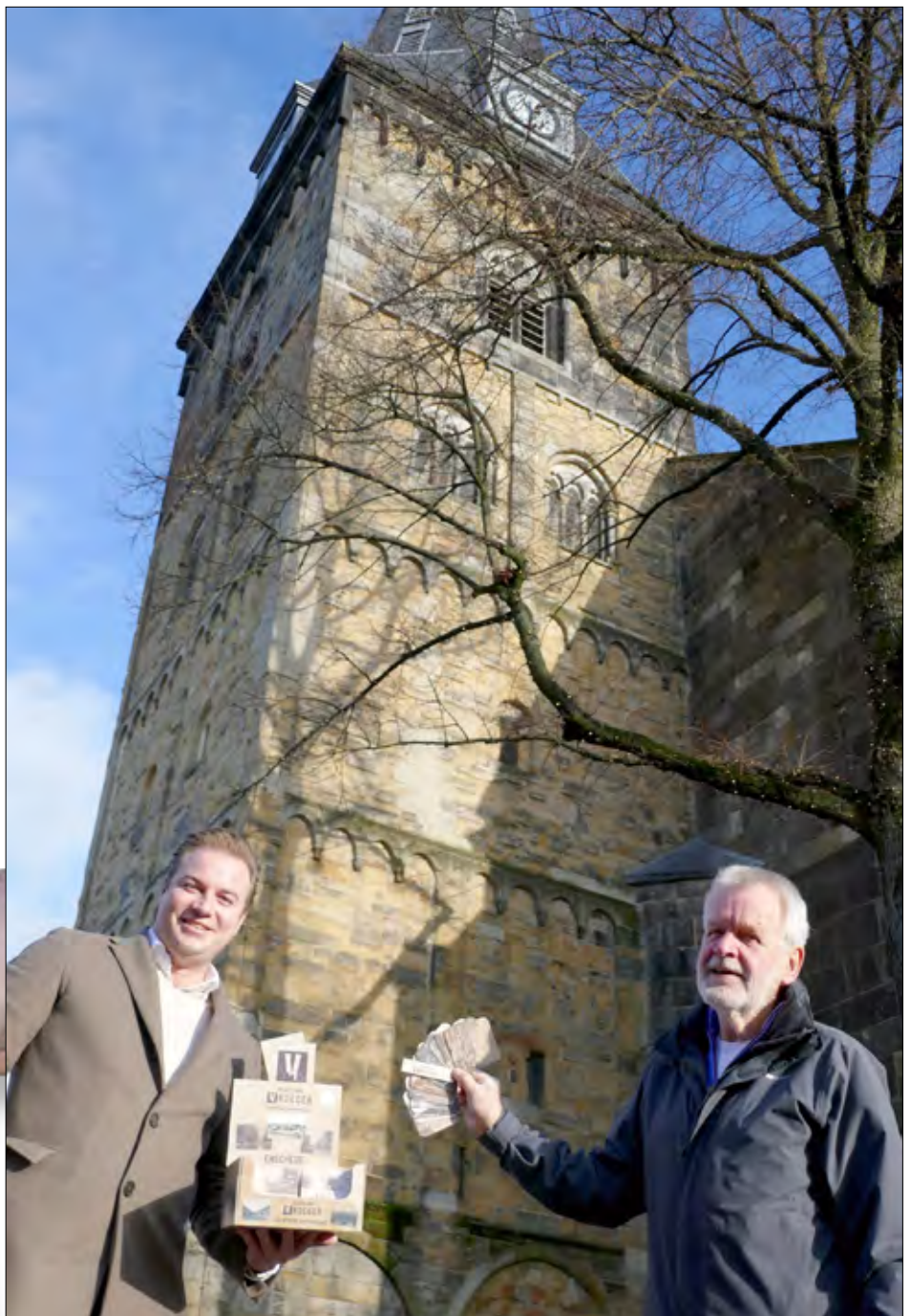
▲ De Historische Sociëteit Enschede-Lonneker heeft foto's van stadsgezichten van het Enschede van vroeger samen met het bedrijf Topviltjes op viltjes laten drukken

Meer informatie kunt u vinden op www.viltjesvanvroeger.nl en het bericht in Tubantia