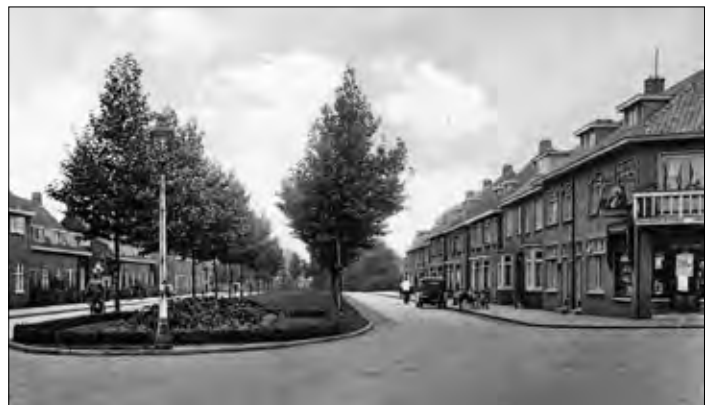
▲ Laaressingel is aangelegd tussen 1920 en 1921, de foto is omstreeks 1930 genomen.