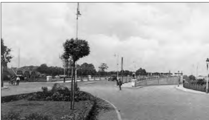
▲ Getfertsingel is aangelegd in 1928, de foto is omstreeks 1935 genomen.