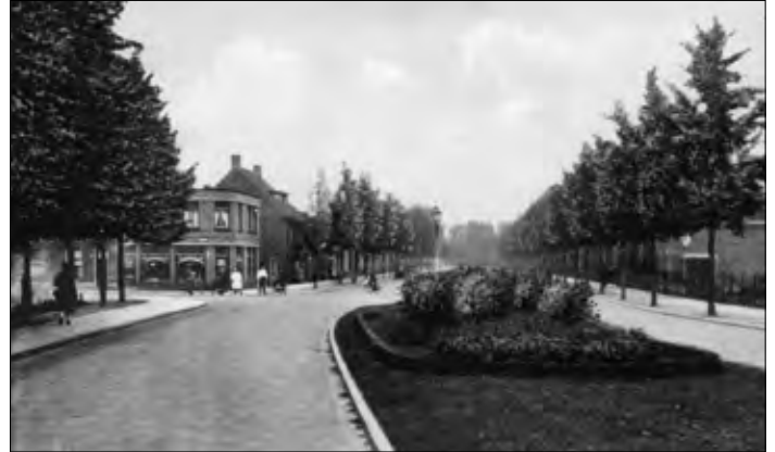
▲ Tubantiasingel is aangelegd in 1919-1920, de foto is omstreeks 1925 genomen.