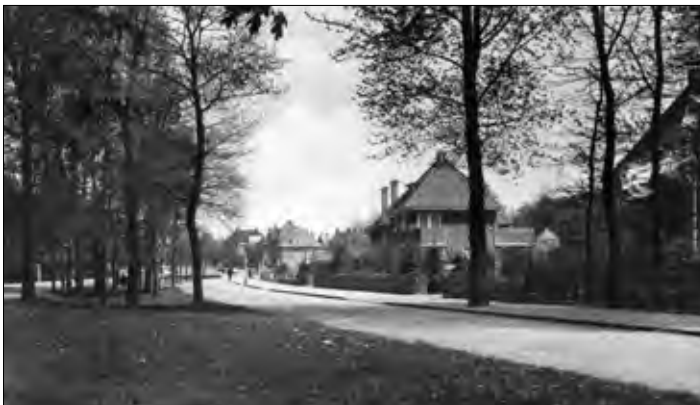
▲ Hogelandsingel is aangelegd tussen 1924 en 1929, de foto is omstreeks 1935 genomen.