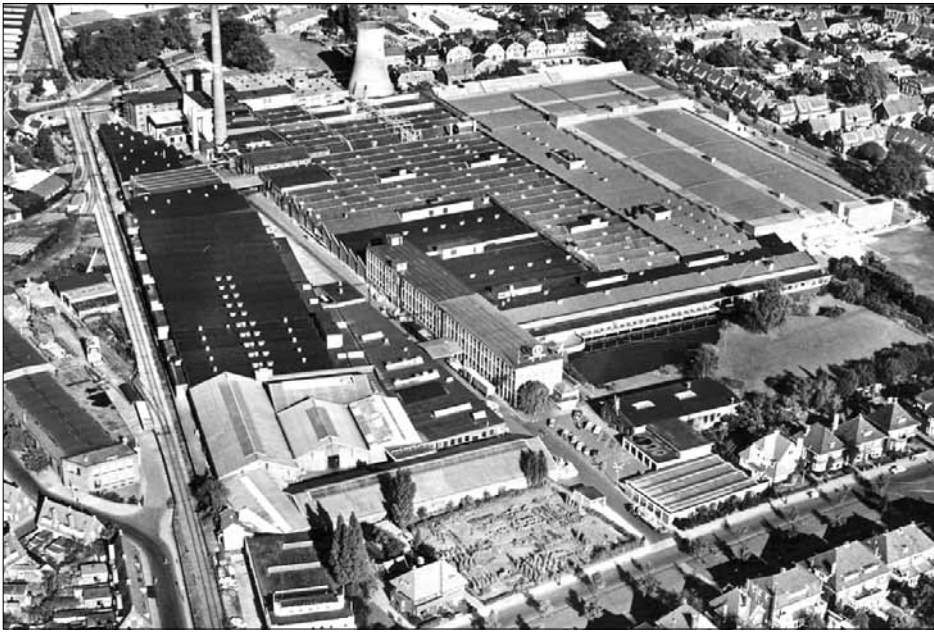
▲ Luchtfoto van de voormalige textiel fabriek Bamshoeve.

► Het grootste deel van de foto wordt ingenomen door het gigantische textielcomplex, daarnaast zijn te zien: rechtsonder de Lasondersingel, links de voormalige spoorlijn Enschede-Lonner-Oldenzaal, links daarvan een klein stukje van het latere vuurwerkcrampgebied en helemaal rechtsboven de H.B. Blijdensteinlaan. De straat van midden onder naar linksboven is vrijwel zeker geen openbare weg, maar behoort tot het Bamshoeve-complex. Sliepsteen-redacteur Willem Bulter vraagt zich af of het mogelijk is het