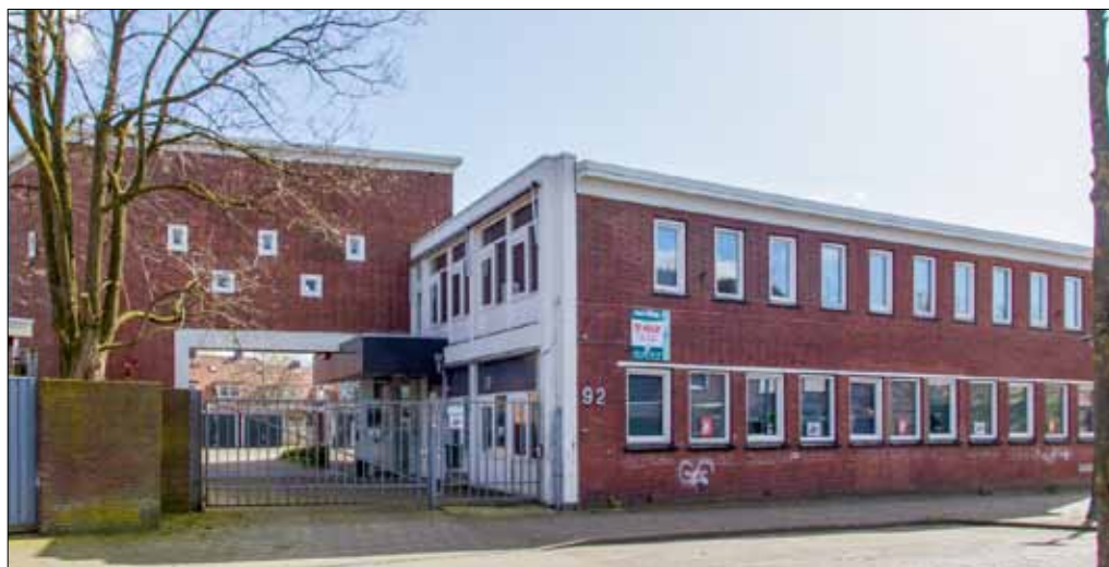
▲ Het voormalige complex van kantoor en werkplaats van van Egteren ligt nog steeds in het Varvik tussen deze 157 woningen aan de Javastraat 92 en wordt op dit moment verbouwd tot een woonzorgcomplex, waarbij het voormalige kantoor met de karakteristieke overkapping behouden blijft. In de bebouwing en 'op de plas' komen woningen, gemeenschappelijke ruimtes en een kantoor van de zorginstelling.

Tot vorig jaar. Het verhaal van de ezel en de steen gaat hier helaas niet op. Er moeten nieuwe verkeersborden komen, en u raadt het al: weer pal voor de vogels, en niet geplaatst bij de andere. Wat jammer dat daar geen oog voor is.