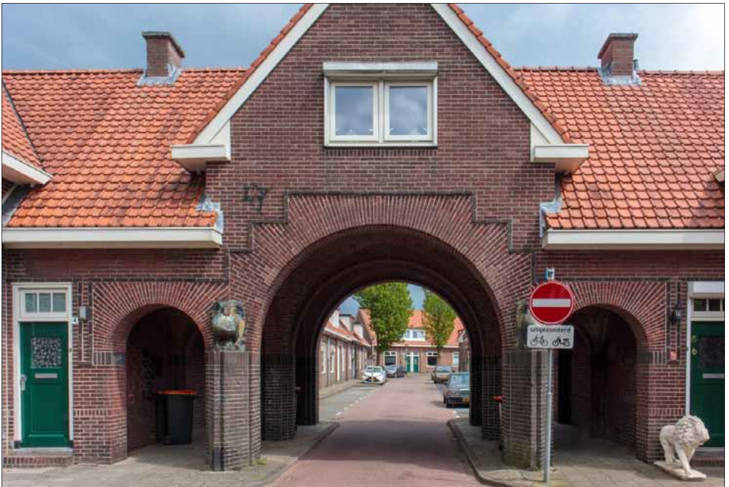
▲ Verkeersbord voor de doorgang naar de Bataviastraat aan het Buitenzorgplein.