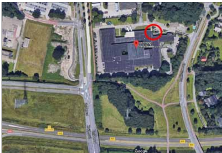
◀ Locatie van de eerste steen in het pand van Philips.