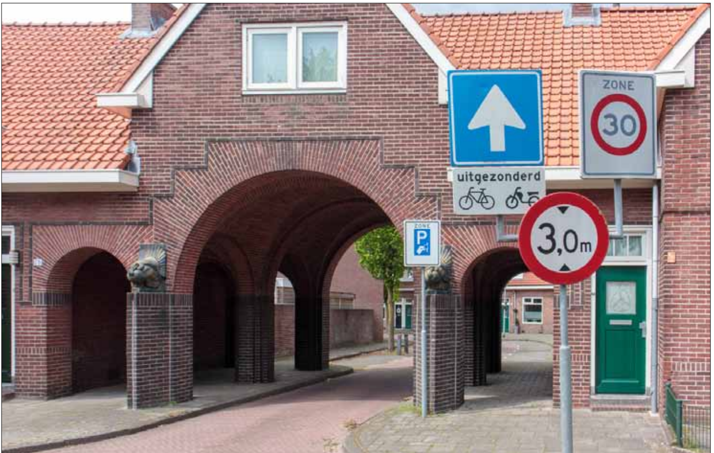
▲ Verkeersborden voor de doorgang naar de Bataviastraat aan de Varviksingel.

In 1928 koopt Woningbouwvereniging De Volkswoning een terrein in het Varvik om daar door aannemer van Egteren een complex van 157 woningen te laten bouwen, ontworpen door architect Blom.