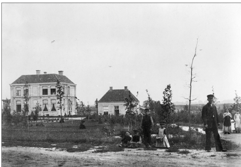
▲ Een van de foto's waarvan het Stadsarchief Enschede niet precies kan achterhalen waar of wanneer ze gemaakt zijn.