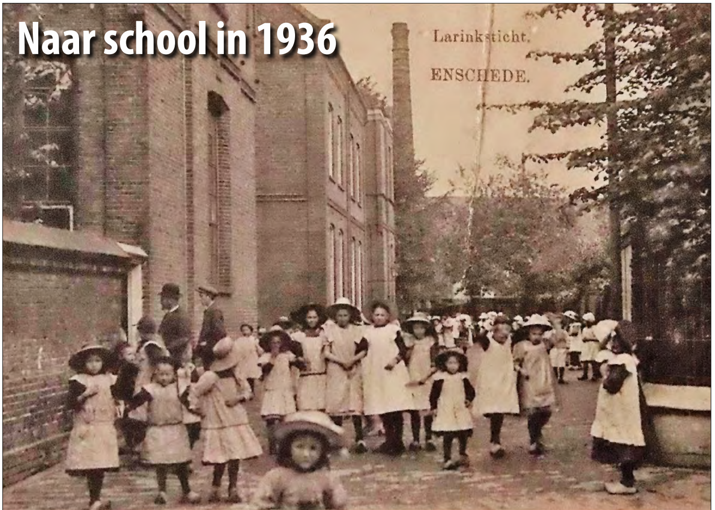
▲ De kleuterschool van de zusters van het Larinksticht.

De kleuterschool van de zusters van het Larinksticht in Enschede in de binnenstad kwam je binnen via een hoge grijze stenen trap waar je een lange gang zag met aan de rechterkant drie klaslokalen, aan de linkerkant een hoge trap waar een kelder onder zat en aan het eind van die vrij lange gang kon je met een trap weer naar buiten.