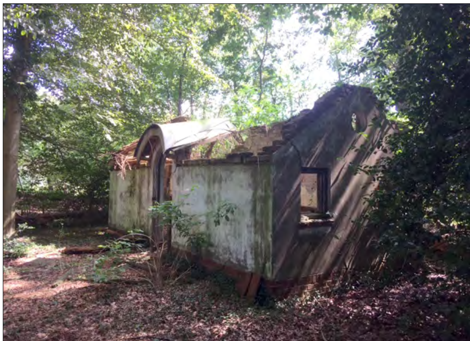
▲ De huidige staat van het kippenhok.

Ik moet eerlijk bekennen, dat ik weinig van mijn familiegeschiedenis wist. Tot ik na het overlijden van mijn vader in zijn geldkistje een briefje aantrof van de gemeente Monster, waar mijn ouders tijdens de oorlogsperiode woonden, waarop vermeld stond dat mijn vader zich had aangemeld als persoon van geheel of gedeeltelijk van 'Joodsche bloede'. Daarnaast lag er een cheque van de Bank voor Handel en Scheepvaart ter waarde van $ 810,-, die nog niet was geïnd. Merkwaardig, want mijn grootouders uit Rotterdam kwamen berooid de oorlog uit. Het scheepsbevrachtingskantoor van mijn opa aan de Parkhaven was bij het bombardement van Rotterdam met alles wat erin lag vernietigd. Mijn ouders hebben hen tot de AOW werd ingevoerd, moeten onderhouden. Het leverde nogal wat spanningen op. Waarschijnlijk mede daardoor bleven de familiecontacten vanuit Groningen, waar wij toen