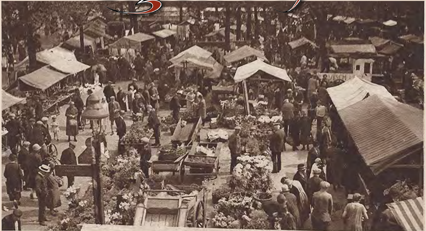
Een kijkje op de Dinsdagsche markt te Enschede, de eerste maal dat deze ook in den namiddag werd gehouden.