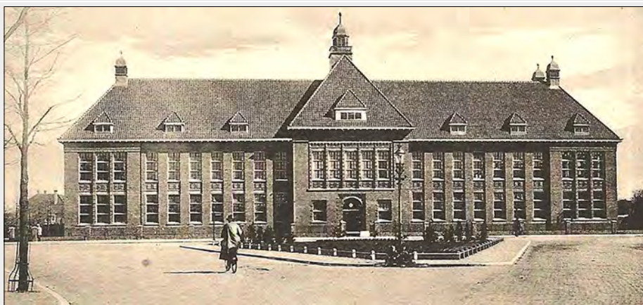
▲ De Enschedese Hogere Textielschool Vereeniging (EHTSV) in 1922.

In de jaren voor de Tweede Wereldoorlog wordt er meestal één keer per jaar een revue of toneelvoorstelling met of zonder bal georganiseerd. In 1944, ten tijde van de Duitse bezetting moet