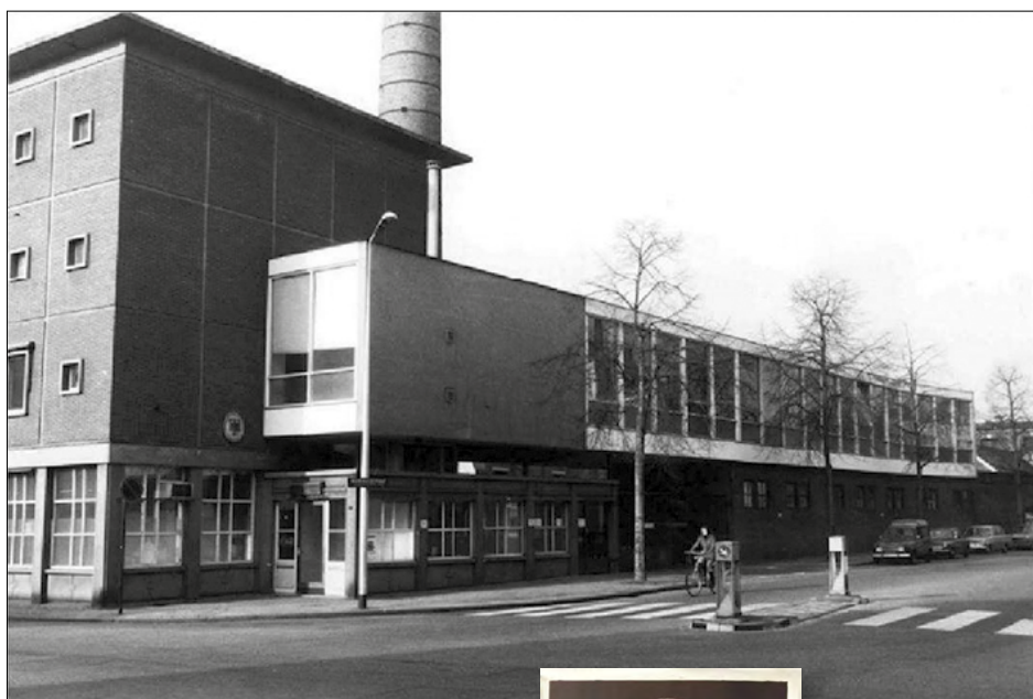
▲ De kantoren van Stoomweverij Nijverheid in de jaren zeventig van de vorige eeuw. Gesloopt in de jaren tachtig.

De overlijdensacte van 28 februari 1945 noemt als plaats van overlijden het traject Langenbielau - Dachau,