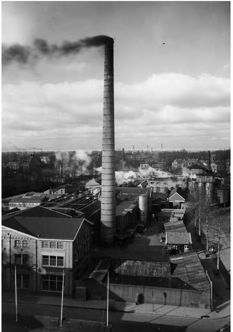
▲ Stoomweverij Nijverheid NV in 1948.

In Stoomweverij Nijverheid, sinds 1941 onder beheer van een Duitse Verwalter, zijn voorjaar 1942 op last van bezetter de honderdduizenden gele Jodensterren vervaardigd, vanaf 3 mei verplicht te dragen door alle Joden vanaf 6 jaar. Ze werden à f 0,04 plus een textielpunt per